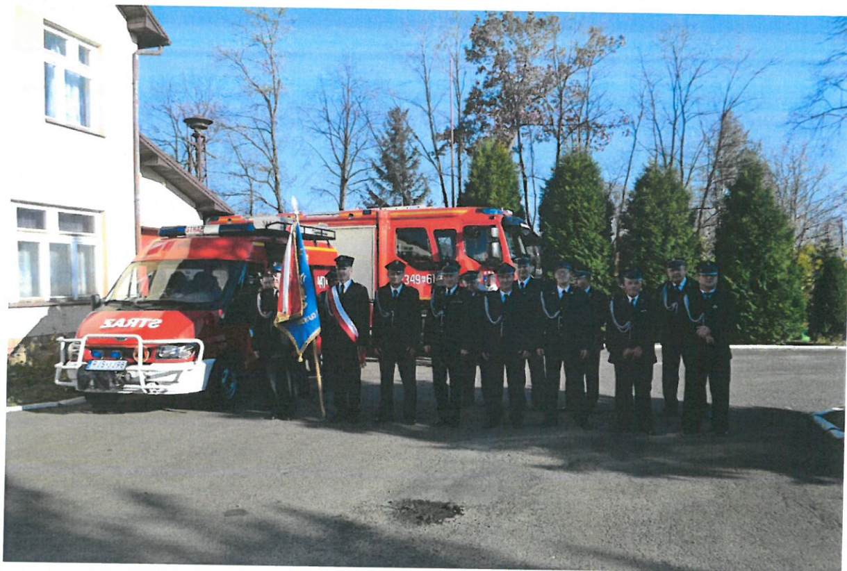
Rysunek 2: OSP w Czekaju podczas uroczystości przekazania samochodu pożarniczego w 2019 roku

Jednostki OSP posiadają znaczną pozycję w szczególności na terenach wiejskich. Prowadzą działalność nie tylko w zakresie ratownictwa i ochrony przeciwpożarowej, ale zajmują się również sportem, edukacją i kulturą. Jednostka Ochotniczej Straży Pożarnej w Czekaju liczy aktualnie 28 członków.