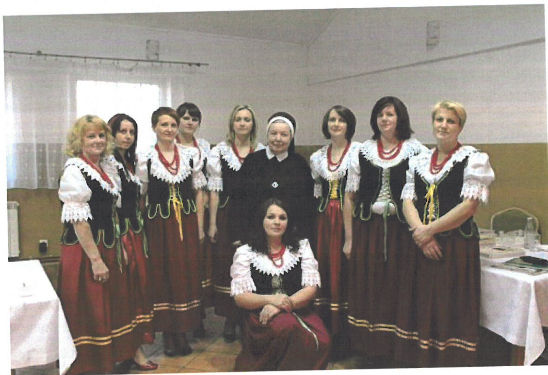
Rysunek 1 Koło Gospodyń Wiejskich wsi Czekaj

Centrum kulturalnym wsi Czekaj jest istniejący Dom Ludowy, który wymaga gruntownego remontu a także doposażenia. Środki budżetowe zarówno sołectwa jak i samej gminy nie są wystarczające, by w odpowiedni sposób wyposażyc Dom Ludowy w potrzebny sprzęt. Działalnością Kulturalną we wsi Czekaj zajmuje się w głównej mierze Koło Gospodyń Wiejskich, OSP w Czekaju oraz Rada Sołecka. Panie zrzeszone w KGW bardzo chętnie uczestniczą w życiu Gminy a także współpracują z Gminnym Ośrodkiem Kultury w Osieku Jasielskim przy organizacji różnego rodzaju festynów, lokalnych imprez, warsztatów czy konkursów. KGW to organizacja, która systematycznie wnosi swój wkład w tworzenie dorobku kulturalnego Gminy Osiek Jasielski. KGW z terenu naszej Gminy rokrocznie uczestniczą w takich wydarzeniach kulturalnych jak: „Święto Chleba”, „ Dni Osieka”, „ Dzień Seniora” w trakcie których zajmuje się głównie oprawą kulinarną przygotowując różnego rodzaju lokalne przysmaki, ale także prowadzą działalność artystyczną.