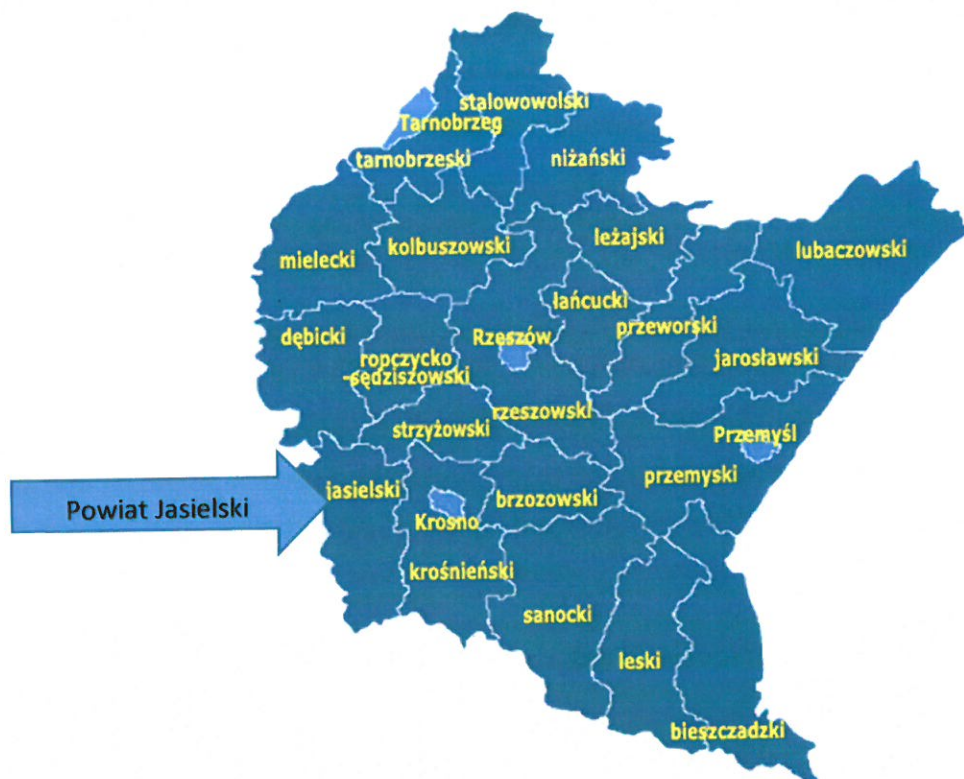
Rysunek 1: Lokalizacja miejscowości Czekaj na tle województwa.

Obszar Gminy Osiek Jasielski w całości jest objęty dorzeczem górnej Wisłoki, które zajmuje tereny zachodniej części Beskidu Niskiego i południową krawędź Pogórza Jasielskiego. Jest to teren posiadający unikalne walory krajobrazowe, przyrodnicze i historyczne. Stanowi wspaniałe tereny rekreacyjne, wczasowe, które ma prawie każda miejscowość Gminy Osiek Jasielski.